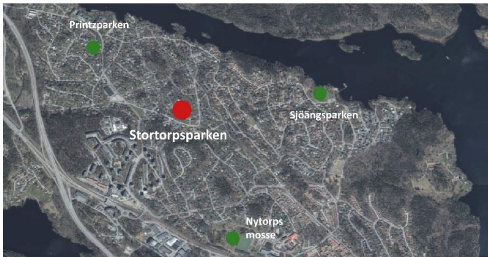
Bild 1. Parker i Trångsund.

De kommunala parker som finns i stadsdelen Trångsund är Nytorps mosse, Printzparken och Sjöängsparken.