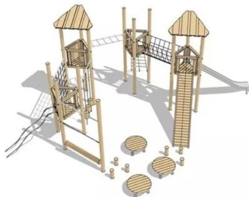
Bild 6 - 7. Närparken med klätterlek.

Flera olika sittplatser föreslås; parksoffor, bänkbord och parkbänkar runt träd. En rastplats med grill och pergola anläggs där Huddingeleden passerar. Parkens kulturkaraktär förstärks med perenner. Belysningen rustas upp längs gångstråket och kompletteras med stämningsfull ljussättning vid lekplatsen (bilaga 4).